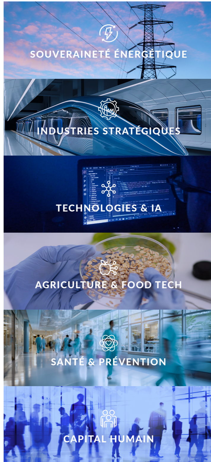
ILLUSTRATION DES THÉMATIQUES D'INVESTISSEMENT POTENTIELLES

En contrepartie, le FCPI détiendra des parts des sociétés accompagnées. Les investissements se font dans des sociétés non cotées en bourse, et présentent donc des risques, notamment l'absence de liquidité des titres non cotés.